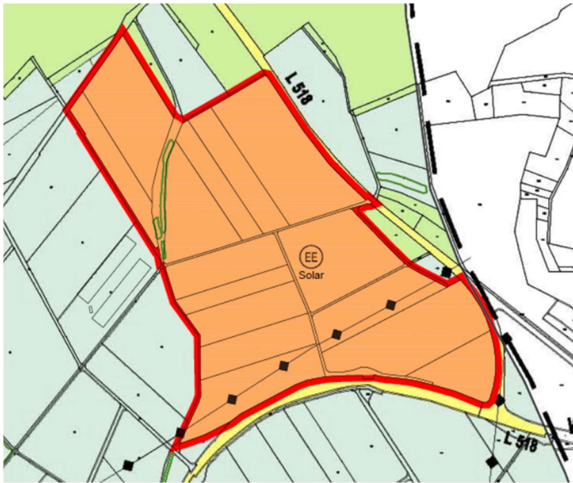
Auszug aus der Änderung des Flächennutzungsplans der Stadt Buchen – Fortschr. 2013-

Das Gebiet der geplanten Sonderbaufläche liegt nördlich von Rinschheim zwischen den beiden Landesstraßen. Die ackerbaulich genutzten Flächen werden im Süden von einer 380- KV- Leitung durchzogen, westlich befinden sich drei größere Putenmastställe.